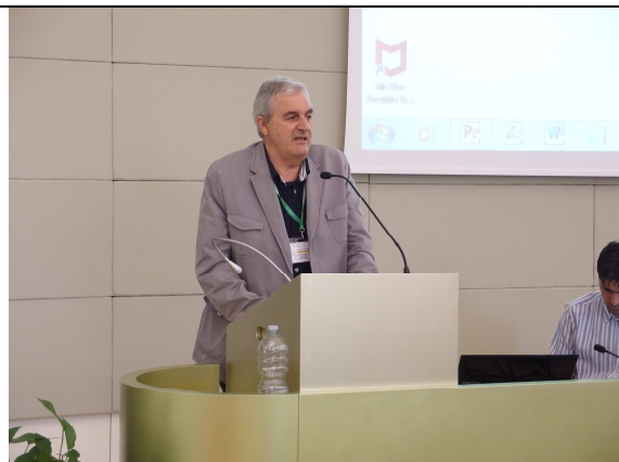
FOTO DEL CONVEGNO